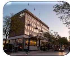
Fletcher Boutique Hotel Slaak in Rotterdam