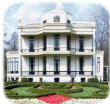
Kasteel de Vanenburg Nabij Putten