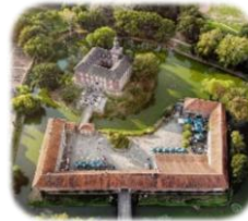
Kasteel Limbricht Nabij Sittard