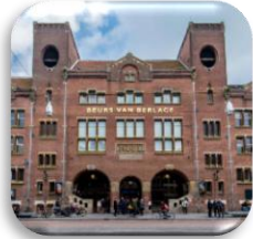
Meet Berlage In Amsterdam