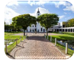
De Ruwenberg Nabij 's-Hertogenbosch